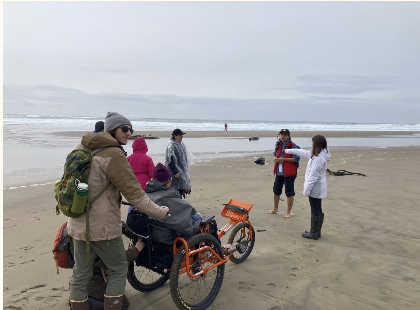
นักเรียนที่ใช้รถ Advenchair ที่ค่าย Meriwether