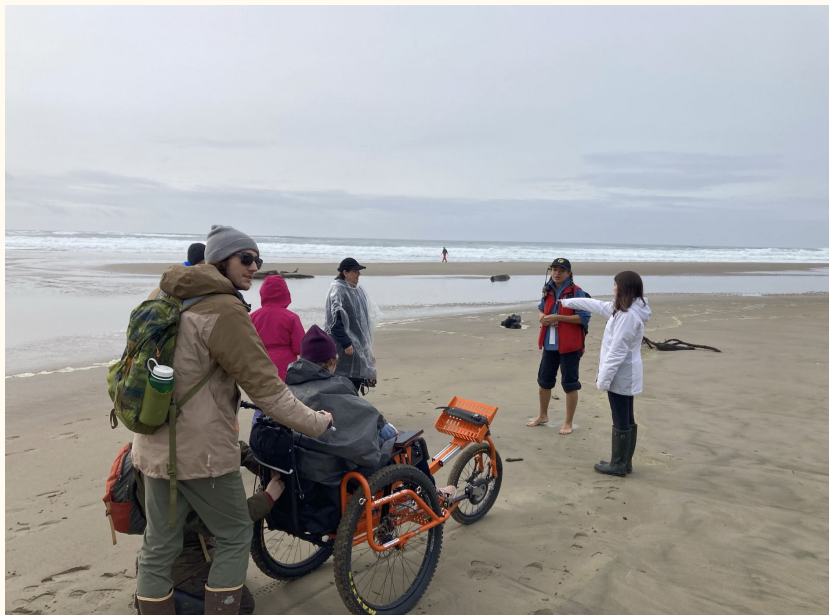
Ученик пользуется инвалидной коляской Advenchair в лагере Meriwether